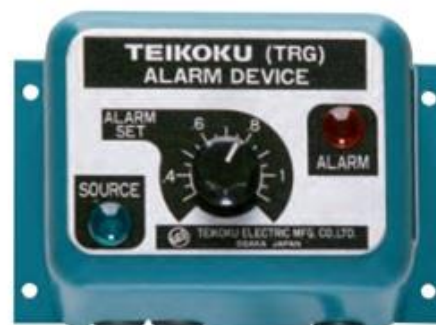
Alarm Device (Optional)

Система контроля Р-монитор отслеживает минимум и максимум потребляемой энергии. Поддерживаемые функции необходимы, чтобы эффективно контролировать и управлять насосами.