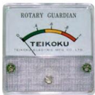
Panel-mounted meter for Remote Monitoring (Optional)